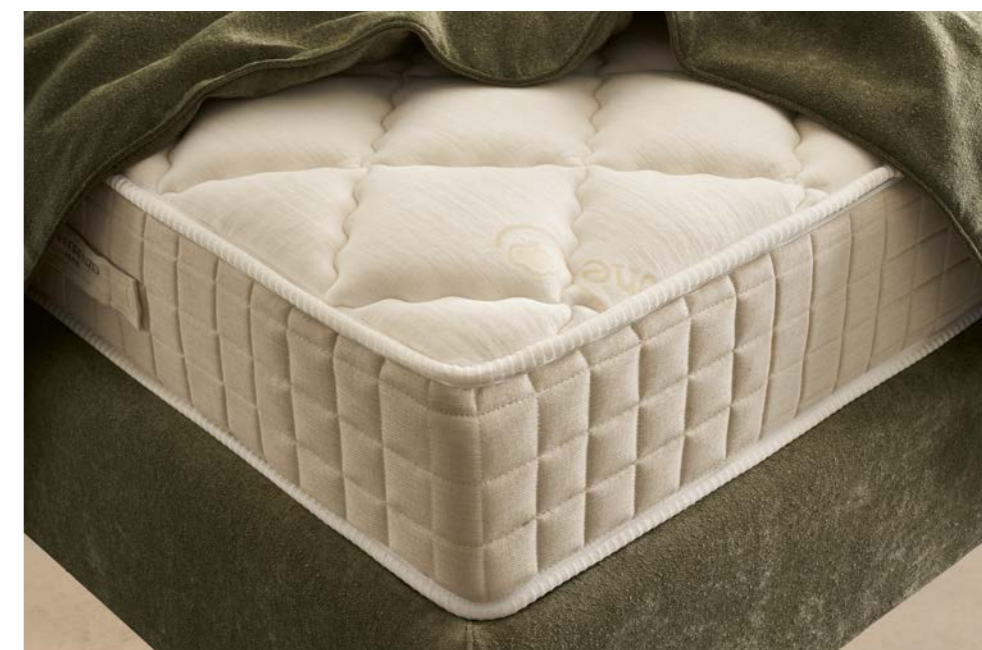
Incanto Memory 6.0

G - IMBOTTITURA: LATO B: FIBRA SOSTENIBILE CERTIFICATA OEKO-TEX® STANDARD 100, GARANZIA PER LA SALUTE DEL CONSUMATORE.